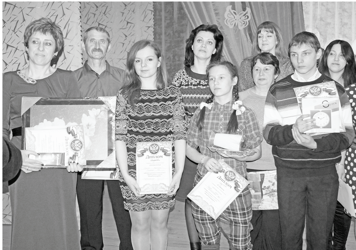
Победители и дипломанты.

Конкурс закончился как всегда позитивно. До новых встреч! Александр Капцов.